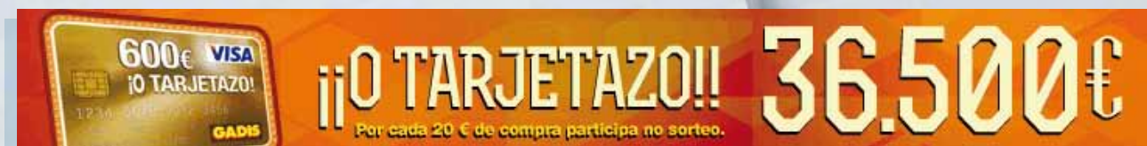
Megabanner - 728x90