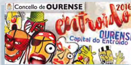
Medio Roubapáxinas - 300x150