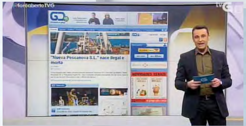
GC citado no programa Foro Aberto da TVG

GC é unha marca tan coñecida que mesmo foi incluída en libros de texto, como este da Editorial SM para a asignatura de Lingua