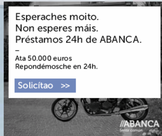
Roubapáxinas-Medium Rectangle - 300x250